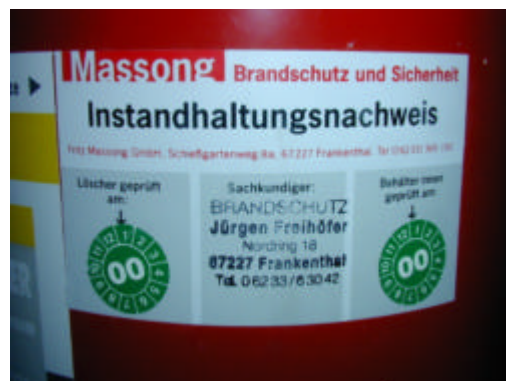
Prüfsiegel eines Feuerlöschers

Für die Mindestzahl der bereitzuhaltenden Feuerlöscher empfehlen wir folgende Richtwerte: