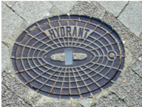
Abdeckung eines Unterflurhydranten