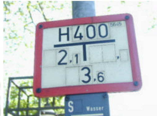
Hinweisschild eines Unterflurhydranten

Nutzen Sie keinesfalls gekennzeichnete Feuerwehrstellflächen und -zufahrten. Das Gleiche gilt für Einrichtungen wie Löschwassereinspeisungen, Überflurhydranten oder auch Notausgänge von Gebäuden.