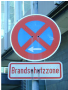
Hinweis auf eine Brandschutzzone

Nutzen Sie keinesfalls gekennzeichnete Feuerwehrstellflächen und -zufahrten. Das Gleiche gilt für Einrichtungen wie Löschwassereinspeisungen, Überflurhydranten oder auch Notausgänge von Gebäuden.