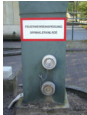
Einspeisung für eine Sprinkleranlage