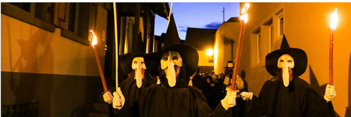
Leider hat uns die "Corona-Pest" noch immer fest im Griff.

Fest steht: Das „Peter-und-Paul-Fest“ kann auch in diesem Jahr nicht stattfinden. Es gibt Ideen und Vorschläge für kleinere „interne“ Aktionen zum Peter-und-Paul-Datum und darüber hinaus auch später im Jahr, die allerdings noch nicht ausgereift sind. Es bleibt dabei vor allem abzuwarten, wie sich die Corona-Situation entwickelt. Die Ideen werden unter geltenden Pandemie-Bedingungen zum geeigneten Zeitpunkt auf ihre Durchführbarkeit und Zulässigkeit zu prüfen sein. Ein virtuelles Fest wie 2020, welches nicht zuletzt dem Start einer eigenen Mediathek und des eigenen YouTube-Kanals „PUP-Stream“ zu verdanken war, wird es nicht geben. Ob eventuell im Vorfeld des eigentlichen Festwochenendes einzelne Aktionen aufgezeichnet und zum Abruf bereitgestellt werden, darüber wird nachgedacht. Außerdem gibt es Überlegungen einzelner Gruppen dazu, was eventuell am Festwochenende in Eigenregie initiiert werden kann. Auch hier bleibt abzuwarten, was möglich und erlaubt sein wird. Viele ungelegte Eier also in ungelegenen Zeiten.